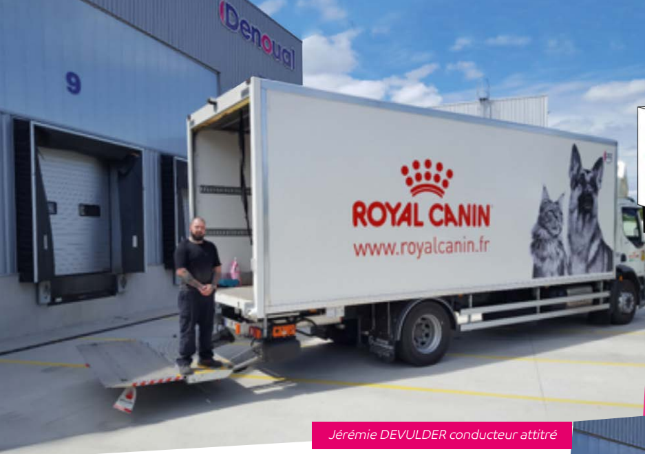
Jérémie DEVULDER conducteur attitré